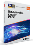
Bitdefender Family Pack