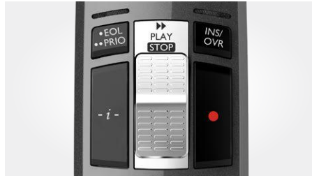
Bedienung per Schiebeschalter (schneller Vorlauf, Aufnahme/Wiedergabe, Stopp, schneller Rücklauf)