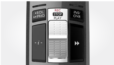
Bedienung per Schiebeschalter (Aufnahme, Stopp, Wiedergabe, schneller Rücklauf)