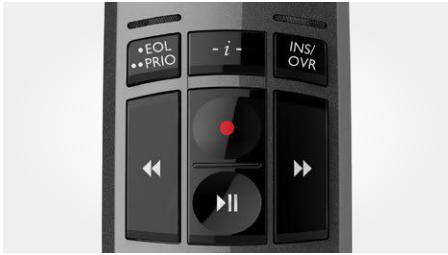
Bedienung per Drucktasten