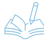
PROZESSGESTALTUNG UND -DOKUMENTATION