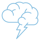
BRAINSTORMING UND IDEENFINDUNG

Mit MindManager können Sie diese Informationen zusammenführen und aufbereiten, Ihre Produktivität steigern, Ihre Pläne und Projekte umsetzen sowie wirksamer mit anderen Personen zusammenarbeiten und kommunizieren.